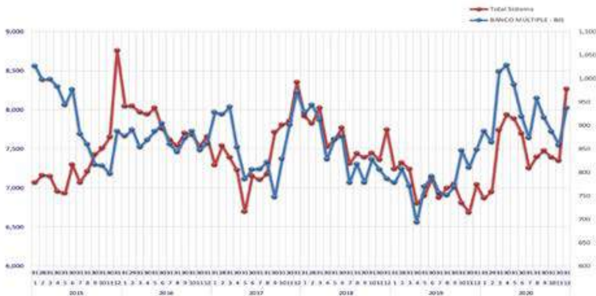
Gráfico N° 1 EVALUACIÓN MENSUAL DE LA LIQUIDEZ (Expresado en Millones de Dólares)

En el gráfico anterior, se puede apreciar lo señalado precedentemente, respecto del nivel de liquidez del Banco, que desde mayo de 2019 viene presentando una tendencia creciente, y un comportamiento siempre por encima del mercado, como resultado de la política prudencial que aplicó el Banco, preparándose a los procesos eleccionarios de las gestiones 2019 y 2020, lo cual determinó que seamos el segundo banco con menos retiros del público y siendo el banco de refugio de muchos cliente nuevos que vieron en el banco la gran solvencia del mismo. En general al 31 de diciembre de 2020, el Banco y el sistema llegaron a contar con niveles de liquidez similares a los de enero y febrero de 2018.